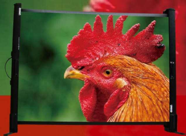
30吋, 40吋, 50吋