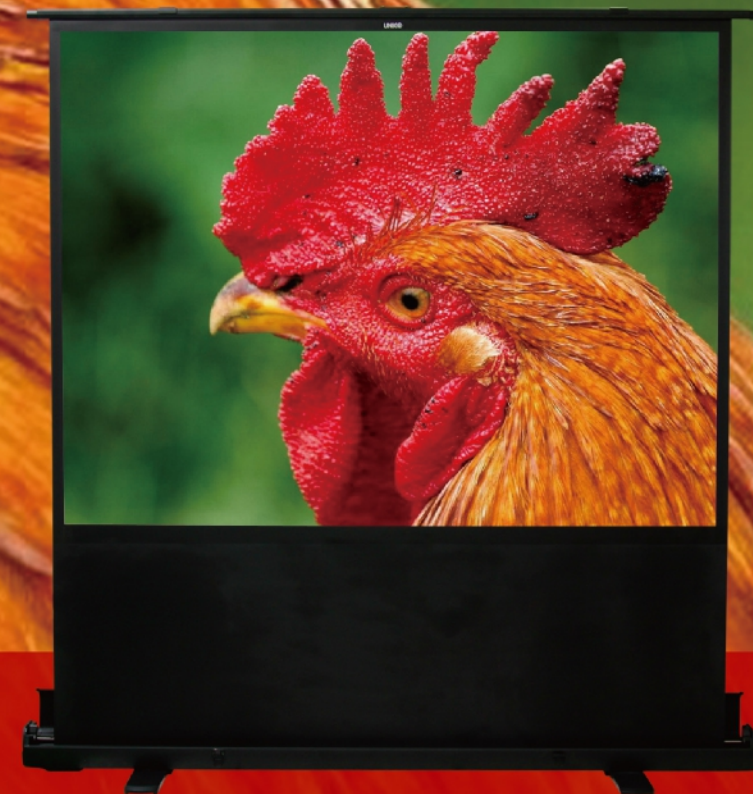
60吋, 80吋, 100吋